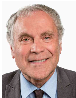
Kamerlid Schepen in Zaventem