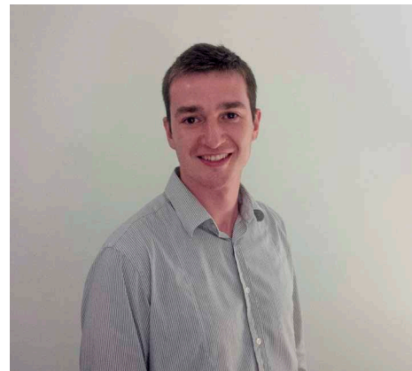
Voorzitter JONGCD&V Zaventem