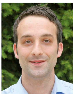
Schepen in Zaventem